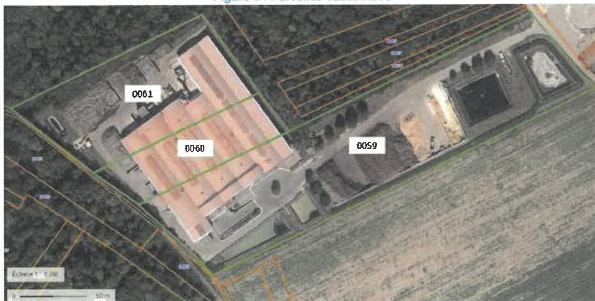
Figure 3 : Parcelles cadastrales